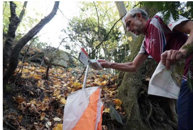
Posten bei der Sprint-Staffel im Rahmen der Hessenmeisterschaft Klassik / 29.10.2017 | -2017