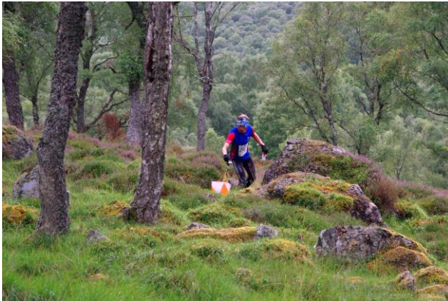
Posten bei der Scottish 6 Days Of Orienteering 2017 / 04.08.2017 | -2017